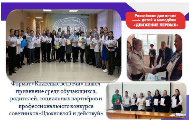
Формат «Классные встречи» нашел признание среди обучающихся, родителей, социальных партнёров и профессионального конкурса советников «Вдохновляй и действуй»

Одно из таких мероприятий «Классная встреча». «Классная встреча» - это Всероссийский проект Российского движения детей и молодежи «Движение Первых» национального проекта «Образование», в рамках которого проходят продуктивные встречи с интересными людьми и представителями самых разнообразных профессий.